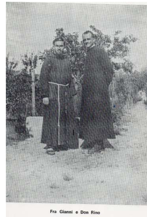
Fra Gianni e Don Rino

Gli elaborati in cartaceo o in DVD non devono arrecare firme o contrassegni della scuola d'appartenenza, ma essere accompagnati da busta chiusa, contenente i dati anagrafici dell'Autore (nome, cognome, scuola d'appartenenza, indirizzo, città, titolo dell'elaborato con indicazione della sezione A o B cui è destinato e dichiarazione che è frutto della propria creatività e non lede i diritti di terzi). Stessa procedura per la sezione C adulti, per i quali è auspicabile un contributo spese di € 10 da inserire nella busta per il formato cartaceo e per il formato elettronico da versare su posta-pay che comunicheremo al ricevimento dell'elaborato.